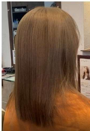
ダブルカラー施術後